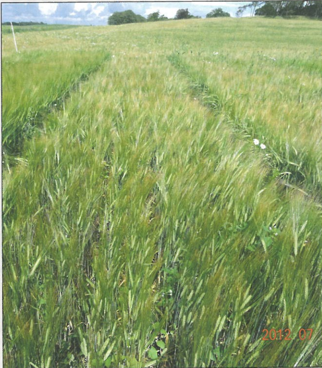
Simba i parcel med placeret gødning, sorten har lav konkurrenceevne over for ukrudt.