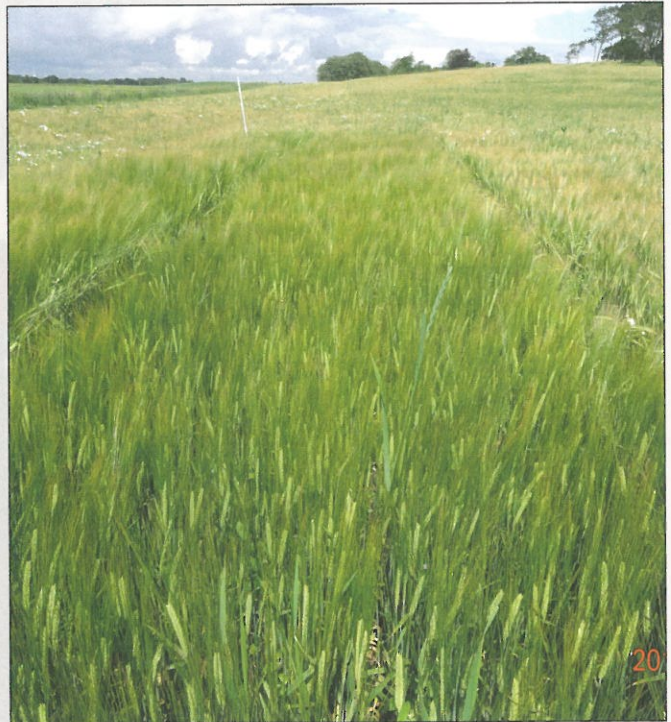
Quench i parcel med placeret gødning, den er både højere og tættere i væksten end Simba.