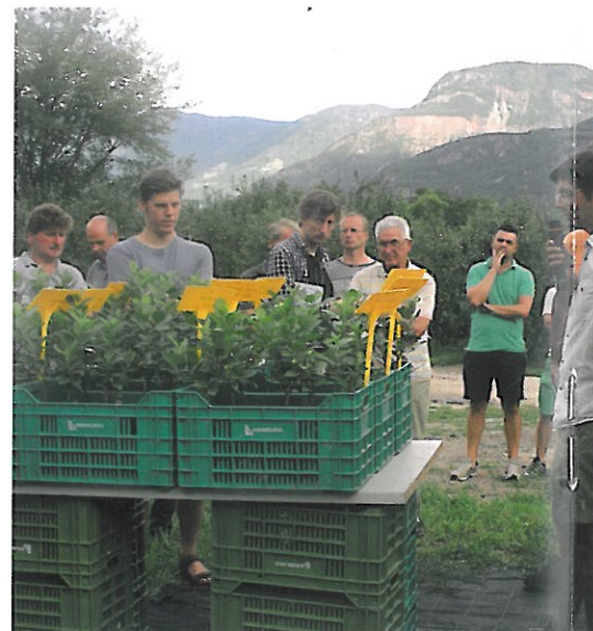
Informationen beim Lokalausgleich im Feld.