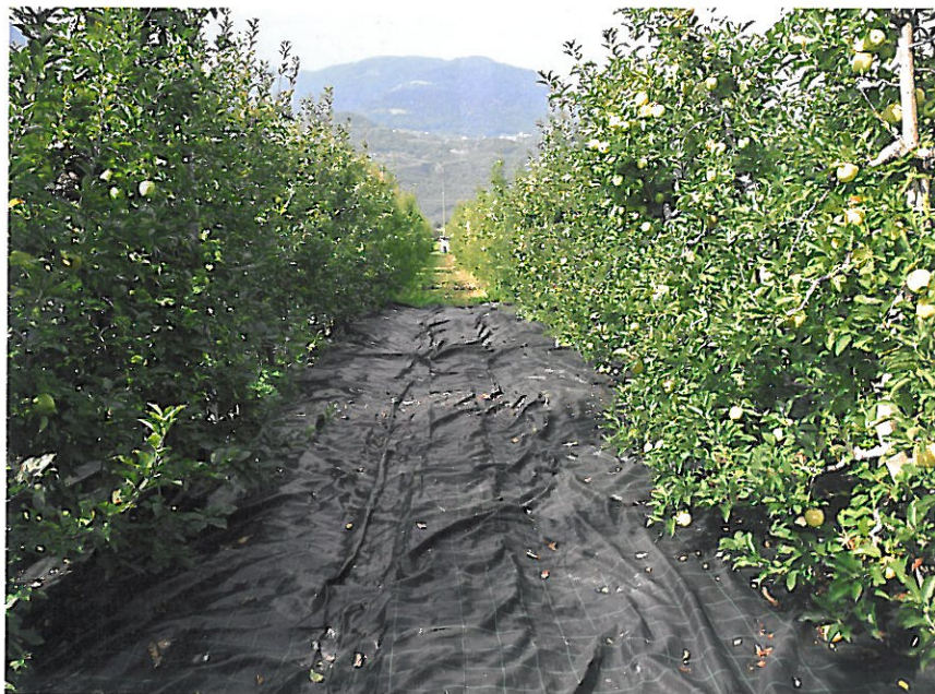
Die Bodenabdeckung mit Folie zur präventiven Alternaria -Bekämpfung brachte keinen nennenswerten Erfolg.

Die diesjährigen Versuche mit Hagelnetzabdeckungen gegen die Apfelwickler bestätigten die Ergebnisse der vergangenen Versuchssaisonen und demonstrierten einmal mehr den Erfolg der Netze gegen den Schädling. Dabei erzielte die Abdeckung der Einzelreihen wieder die bessere Wirkung als die Einnetzung eines ganzen Blocks. Der Bekämpfungseffekt der Einzelreihe, ob nun im Stammbereich geschlossen oder offen, blieb, wie bereits im Vorjahr, derselbe.