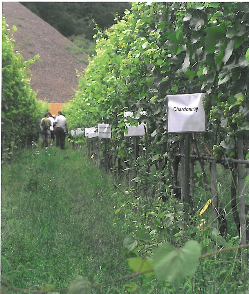
Rebsortenversuch am VZ Laimburg.