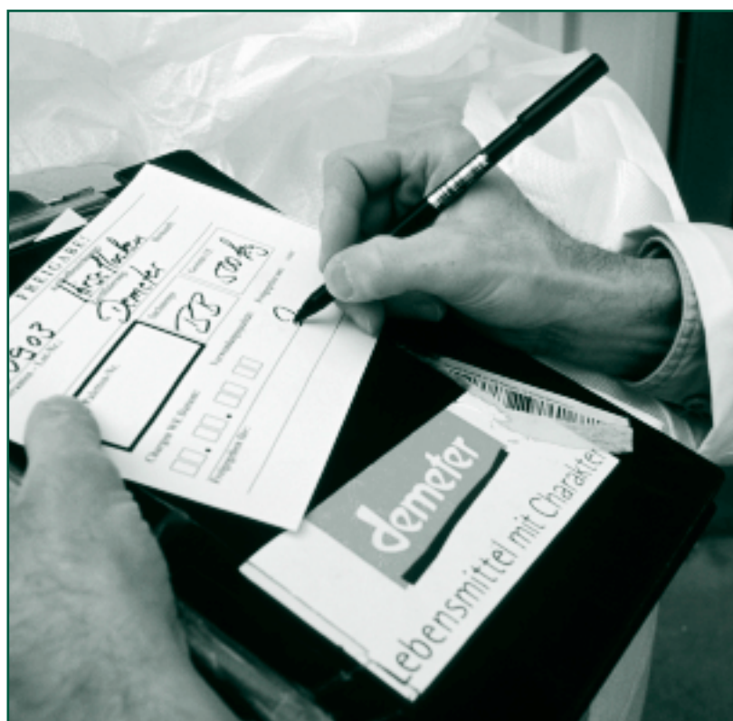
Obrazové chromatografické metody ukázaly vysokou vnitřní kvalitu biodynamických produktů

Půdní reakce, humus: Za 20 let pokusu došlo ke změně reakce půdy v konvenční metodě o -0,1 pH, v organicky obhospodařované půdě o +0,1 pH a v biodynamické variantě o +0,4 pH. Biodynamickou metodou byl zvýšen obsah půdního humusu na 130 %.