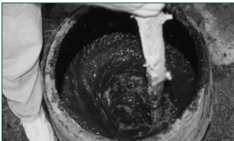
Míchání biodynamického preparátu roháčku

Před inseminací se dává přednost přirozené plemenitbě. V plemenářské práci se klade důraz na dlouhověkost a celoživotní užitek.