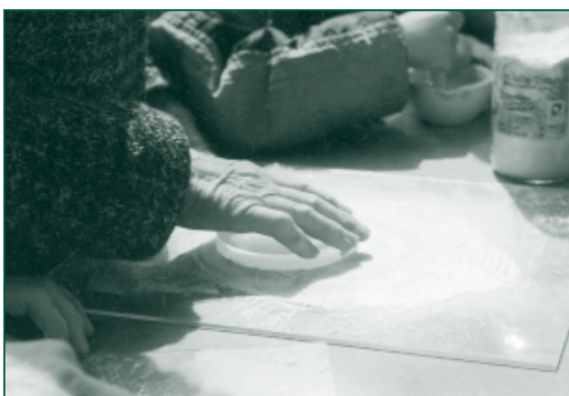
Příprava křemenného biodynamického preparátu

řada kritérií. Srovnání poskytuje švýcarský polní pokus DOK v němž jsou v Oberwilu od roku 1978 zkoumány tři systémy pěstování plodin: biologicko-dynamický (D), ekologický (O) a konvenční (K), vedle nich i kontrolní varianta. Pokus provádí Výzkumný ústav ekologického zemědělství ve Fricku (Švýcarsko). Srovnáván je nejen výnos, ale i vliv metody na ekosystém a také na kvalitu sklizených produktů.