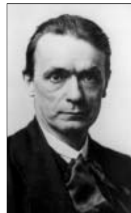
Zakladatelem byl Rudolf Steiner

S biodynamickým zemědělstvím se stále setkáváme a málo mu rozumíme – proto je mu věnována samostatná kapitola