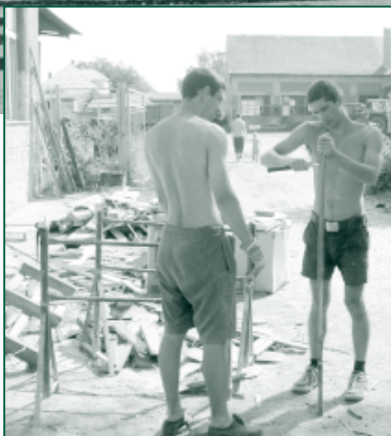
Po povodních v roce 2002 jsme z pole Kosa odstranili hory naplaveného písku.

Uvítáme finanční podporu, věcné dary, sponzorské služby, manuální výpomoc – pomoci může opravdu každý!