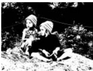
Po nastěhování první pečovatelské rodiny v létě 2003 začal camphill v Českých Kopistech ožívat