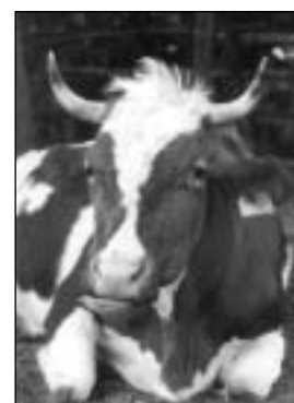
Rohaté krávy – do budoucna pouze výsada biodynamických statků?

Velký význam je připisován péči lidí o zvířata, každodennímu styku ošetřovatele s nimi; proto se na biodynamických farmách tolik nasetkáme s celoročním pastevním chovem skotu s minimální lidskou péčí, jak je poměrně běžný v jiných systémech EZ.