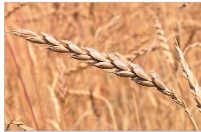
Klas pšenice špaldy

Kromě klasické pšenice seté se postupně rozšiřuje zájem také o pěstování netradičních pšenic, jako je pšenice špalda, ale i pšenice jednozrnka nebo dvouzrnka. Tyto pšenice jsou vhodné pro pěstování v ekologickém zemědělství. Vyznačují se vysokou nutriční jakostí, ale na druhou stranu vyžadují jiné zpracovatelské postupy, než je tomu při klasickém pekařském zpracování. Hodí se pro výrobu různých pekařských a pečivářských výrobků.