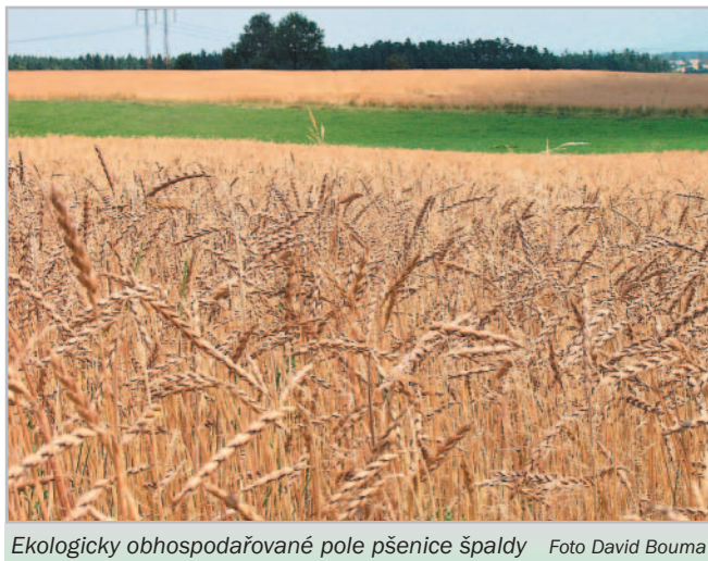
Ekologicky obhospodařované pole pšenice špaldy

kovaných Ústřední kontrolním a zkušební ústavem zemědělským (ÚKZÚZ), a to konkrétně z výsledků pěstování při nižší intenzitě. U nás se šlechtění odrůd pšenice pro ekologické zemědělství žádná šlechtitelská stanice nevěnuje. Je ale možné využít rakouské odrůdy ozimé pšenice například ze šlechtitelské stanice Saatzaucht Edelhof (např. Ekolog). Obecně platí, že v případě nedostatku ekologicky certifiková-