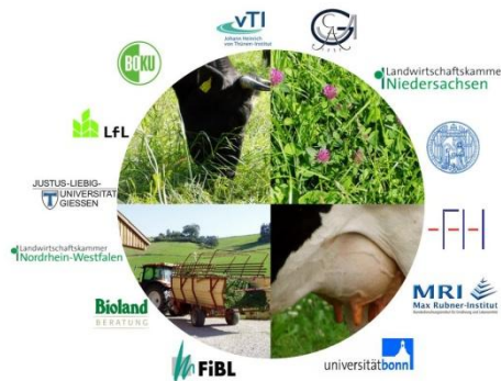
Abb. 1: Projektlogo mit den eingebundenen Institutionen

In diesem interdisziplinär angelegten Projekt arbeiteten insgesamt 13 Organisationen aus den Fachbereichen Graslandwissenschaften, Nutztierwissenschaften und Veterinärmedizin zusammen (siehe Abb. 1). Ziel dieses Forschungsvorhabens war es, Risikoabschätzungen für Stoffwechselstörungen sowie Eutererkrankungen vorzunehmen, ein praxistaugliches präventiv orientiertes Tiergesundheitsmanagement für die Praxis der ökologischen Milchviehhaltung zu entwickeln sowie dieses Managementkonzept anhand einer interdisziplinär angelegten Interventionsstudie auf Praxisbetrieben zu validieren und dessen Praxistauglichkeit zu demonstrieren.