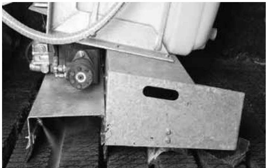
Abbildung 1: Wirkungsweise des Spaltenreinigungssystems bestehend aus den drei Elementen Hochdruckreinigungsdüsen, Räumstern (Zwischenspalt) und Gummischieber.

Das Stallklima (Temperatur und rel. Luftfeuchte) wurde mittels Datenloggern im Stall an zwei Punkten erfasst. Zur Überwachung der Tierpräsenz wurden im Stall Videokameras installiert und mit Hilfe von Langzeitvideorekordern das Tierverhalten dokumentiert.