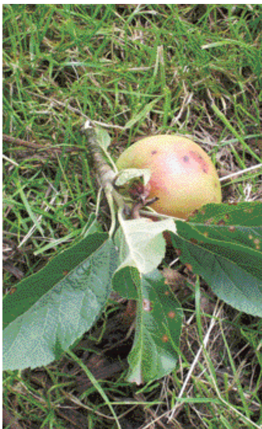
Een aangetaste appel met de typerende paarsachtige symptomen. Opvallend zijn ook de vele bladvlekken in de buurt van de appel.

De veroorzaker blijkt de schimmel, Diplodia seriata te zijn, (ook wel Botryosphaeria obtusa of Sphaeropsis malorum genoemd). Deze schimmel tast blad en vrucht van appelbomen aan en is bekend uit warmere streken. Ze komt onder meer ook voor in druiven. De schimmel is in Noordwest-Europa de laatste jaren toegenomen. Dit heeft volgens Duits onderzoek te maken met het