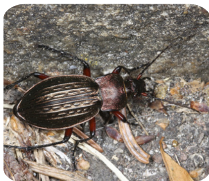
Loopkevers: Een zeer diverse groep met 100den soorten in Nederland. Zowel de larven als de volwassen kevers eten andere insecten.