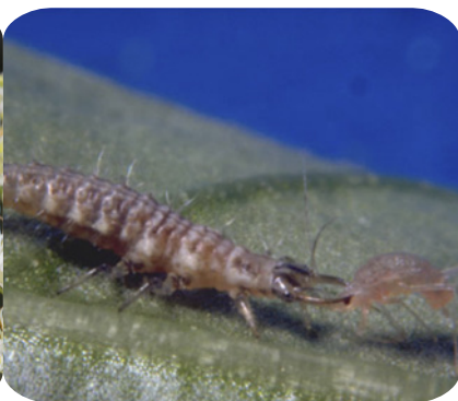
Gaasvliegen: Nuttige insecten waarvan de volwassenen op de bloemen afkomen (links) en hun larven schadelijke insecten opeten (rechts).