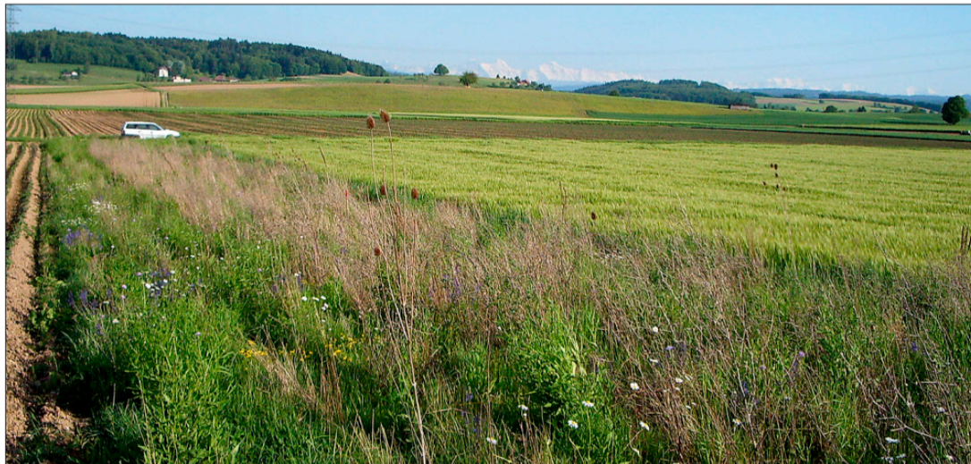
Säume sind dauerhafte Strukturen, in welchen sich die Natur über viele Jahre voll entfalten kann.

Säume müssen in der Regel neu angelegt werden. Der im Boden vorhandene Samenvorrat reicht nicht aus, um artenreiche Pflanzenbestände hervorzubringen. Wichtig für das Gelingen eines Saumes sind ein geeigneter Standort und eine sorgfältige Saatbettvorbereitung. Standorte für Säume sollten