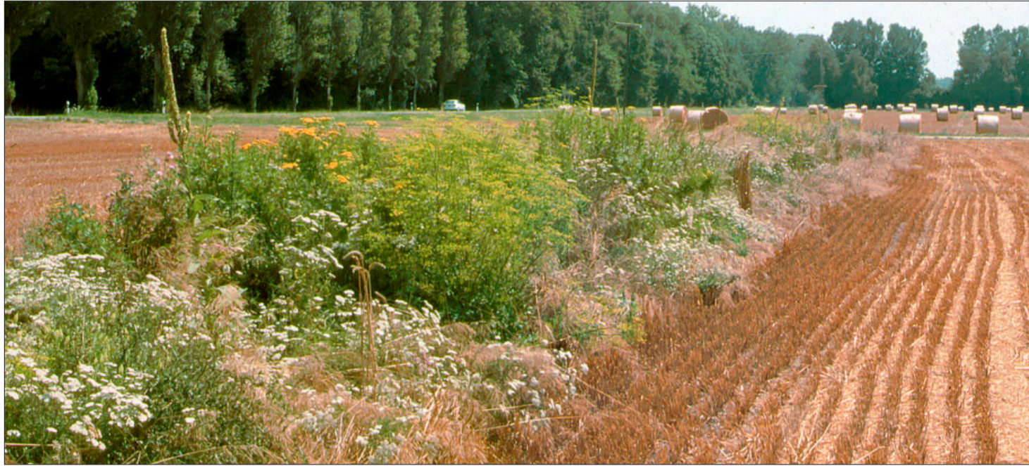
Brachen sind wichtige Rückzugsgebiete für viele Kleintiere im Kulturland.

Die richtige Standortwahl ist entscheidend für das Gelingen von Brachen und bestimmt das Ausmass des späteren Arbeitsaufwandes. Sonnige, trockene und eher magere Standorte ohne Staunässe und Problemunkräuter sind optimale Standorte. Dagegen sind verunkrautete, schattige und feuchte Böden so-