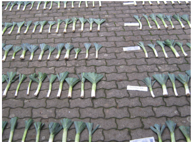
Abbildung 6: Lauchprüfung von A-Sorten im Jahr 2009; Laubfarbe, Schaftlänge und -dicke etc. werden erfasst.

Die Hybridzüchtung bei Lauch wurde verhältnismäßig spät begonnen, bzw. sie ist bei Lauch aufgrund artspezifischer Eigenheiten schwieriger als bei Kohlgewächsen und Möhren. Nachdem aber 1995 die ersten Porreehybriden auf den Markt gekommen sind, steigt ihre Zahl von Jahr zu Jahr rasant an (TRAUTWEIN 2009). Bis vor wenigen Jahren waren Populationssorten aktuell und entsprechend hoch war die züchterische Bearbeitung dieser Sorten. Auch bei Lauch zeigen sich mittlerweile Tendenzen, dass das Augenmerk der Züchterhäuser auf die Hybriden gerichtet ist. Trotzdem gibt es noch immer lauchproduzierende Betriebe, die mit Populationssorten arbeiten und auch künftig arbeiten wollen, nicht zuletzt wegen des, im Vergleich zu Populationssorten sehr hohen Saatgutpreises, der sechs- bis achtmal höher liegen kann als derjenigen der Hybridsorten. Die Ergebnisse der Sichtungen im Rahmen des hier dokumentierten Projektes können dazu beitragen, ein weiterhin genügendes Angebot an anbauwürdigen Populationssorten zu sichern.