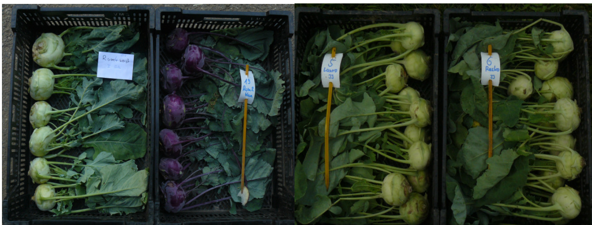
Abbildung 3: Kohlrabi bei der Erfassung der marktfähigen Ware.

Um die Ergebnisse der Vorjahressichtungen auf den beiden anderen Standorten zu prüfen, wurden fünf der bereits gesichteten Sorten in zwei Sätzen angebaut. Die Aussaat erfolgte am 16. April und am 26. Mai, gepflanzt wurde am 14. Mai und am 24. Juni. Die Versuchsfläche war wie im Vorjahr lehmiger Sandboden mit Vorfrucht Wickroggen. Der Sommer war ausreichend feucht mit regelmäßigen Niederschlägen und durchschnittlichem Temperaturverlauf, ohne längere Hitzeperioden. Die Bonituren des ersten Satzes konnten am 13. und 25. Juni durchgeführt werden, die des zweiten Satzes am 30. Juli beziehungsweise 15. August.