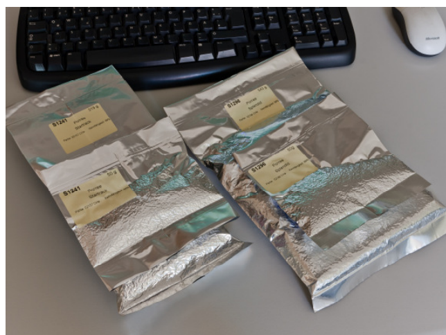
Abbildung 5: Das Nachbau-Saatgut wurde in aluminiumbeschichtete PE-Tüten in die Langzeitlagerung (-18° C) überführt. Die Verwaltung der verschiedenen Muster wurde in einem Warenwirtschaftssystem realisiert, das mit der Online-Datenbank verknüpft ist.