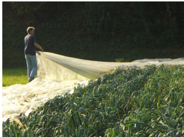
Abbildung 2: Für Pflege-, Bonitur- und Erntearbeiten musste der Bestand vom Kulturschutznetz befreit werden.

Zum Schutz vor Lauchfliege und Lauchmotte wurde vom 17. Juli bis 16. Oktober ein Kulturschutznetz aufgelegt. Die Witterungsverhältnisse waren für Lauch günstig - es fiel genügend Niederschlag und es gab über den Sommer keine längeren Hitzeperioden. Zur Erntezeit herrschte trockenes, warmes Wetter.