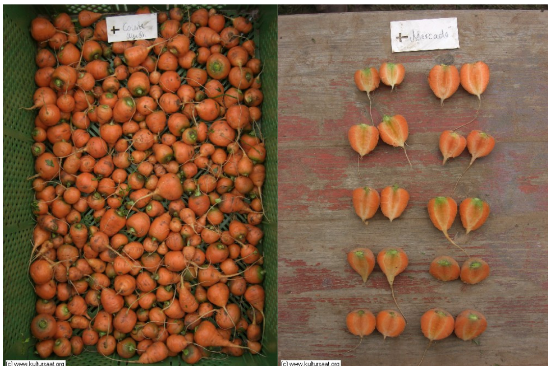
Abbildung 4: Zwei Sorten vom Typ Pariser Markt bei der Bonitur.

Das Frühjahr und der Sommer verliefen mit durchschnittlichen Temperaturen und ausreichender Niederschlagsmenge. Die Bonituren der Pariser Markt-Typen (vgl. Abbildung 4) und der konischen Möhren erfolgten am 5. Juli (Laub) und am 23. Juli (Wurzeln). Die späten Möhren wurden Ende September und Ende Oktober bonitiert. Für die vier zu erhaltenden Sorten wurde die nötige Anzahl Pflanzen aus den Beständen herausselektiert und eingelagert.