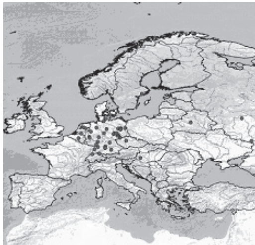
Abbildung 2: Räumliche Verteilung der verwendeten Langzeitversuche

Zur Versuchsdokumentation und erleichterten Dateneingabe bzw. -kontrolle wurde für das CCB eine Schnittstelle zur Literaturverwaltung eingerichtet. Hier können beliebige Dokumente (z.B. Veröffentlichungen, Versuchsberichte) in digitaler Form mit dem entsprechenden Versuch verknüpft werden. Es können auch Datensätze aus Literaturdatenbanken (z.B. Endnote, Reference Manager etc.) im RIS-Format importiert werden.