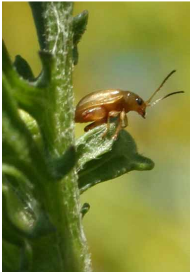
Figuur 3: De Jacobskruid aardvlo Longitarsus jacobaeae op Jacobskruid. De kevertjes zijn ongeveer 2,5 mm lang, de mannetjes ongeveer een millimeter kleiner dan de vrouwtjes. Karakteristiek voor deze groep kevers (Aardvlooien) zijn de dikke achterpoten waarmee ze ver kunnen springen.