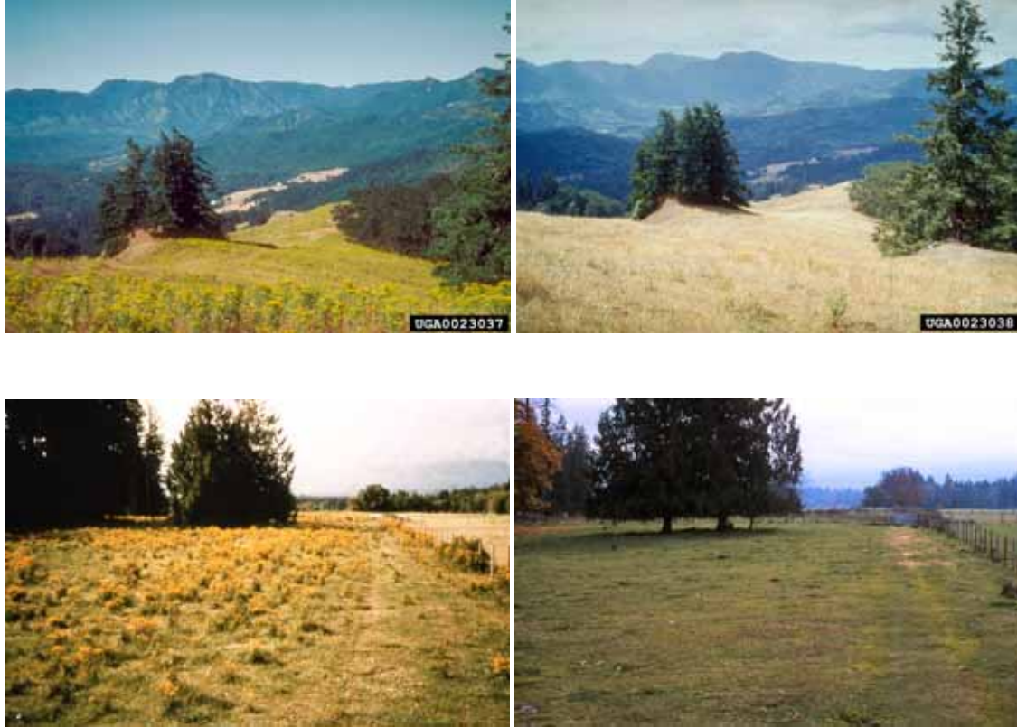
Figuur 2: Voor (links) en na (rechts) de introductie van de Jacobskruidadvlo Longitarsus jacobaeae in de Verenigde Staten (boven) en Canada (onder).