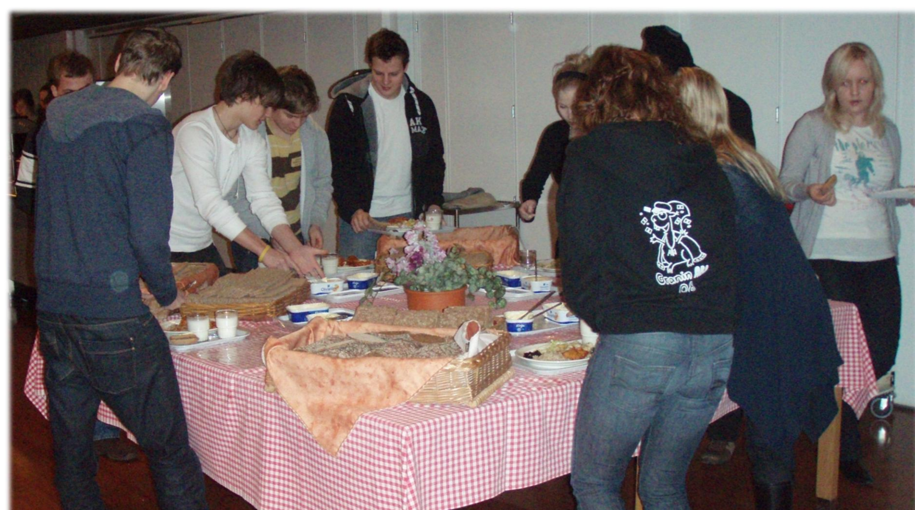
Finnsk skolelunsj