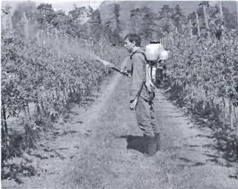
Applikationsgerät: Rücken-Nebelbläser von Birchmeier