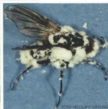
Svampesygdomme er blandt skadedyrenes naturlige fjender. Her er en voksen flue angrebet af svampen Beauveria bassiana .

lige for naturligt forekommende nyttedyr - herunder rovmidler. I fravær af rovmidler opformerer dværg- og spindemider med tab til følge. En dyrkningsstrategi, der fremmer og skåner naturlig regulering, forudsætter derfor, at alle centrale skadedyr tænkes ind. I foråret er markrande kilder til nyttedyr som løbebiller og ederkopper, der siden spreder sig ind i markerne.