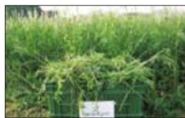
Abb. 1: Blütenstand und Feldbestand der Esparsette ( Onobrychis viciifolia ).

Wollwachstum. Bei Verfütterung von Pflanzen mit höheren kT-Gehalten (5–12 % der TS) wird die Leistung der Tiere reduziert, u. a. weil das Futter weniger schmackhaft ist und schlecht gefressen wird.