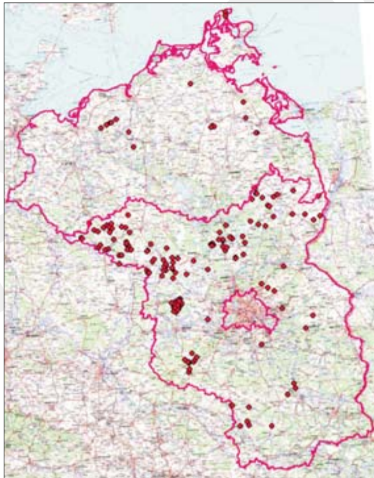
Abb. 1: Nachweise von Echinococcus multilocularis in Mecklenburg-Vorpommern und Brandenburg in den Jahren 2004 und 2005 laut TSN.

nen. Bayesianische Modelle sind eine grundlegende Klasse stochastischer Modelle für Folgen von Zufallsvariablen, die nicht unabhängig sind. Stochastische Modelle sind dadurch gekennzeichnet, dass in ihnen bestimmte Variablen vom Zufall beeinflusst sind. Digitale Landkarten, die das aktuelle Ausbreitungsgebiet einer Infektionskrankheit beschreiben, gehören zu den Systemen, die mit Markov-Ketten dargestellt werden können. Bayesianische Modelle erlauben das Erstellen von Risiko-Karten bezüglich der Infektion von Füchsen mit E. multilocularis auf Gemeinde-Niveau und eine Verfolgung der zeitlichen Effekte auf monatlicher oder jährlicher Basis.