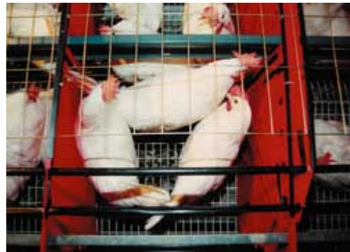
Burhøns.