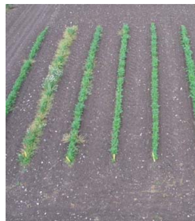
Figur 2. En -rækket forsøgsmaskine til rækkedampning. Til højre gulerødder sået i dampbehandlede bånd. Række nr. 2 fra venstre er ubehandlet, række nr. 3 er 70°C, række nr. 4 er 80 °C mens række nr. 5 er håndluget.